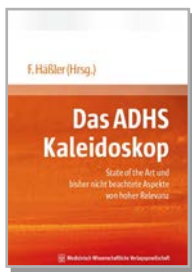
ISBN 978-3-939069-66-9 2009, € 29,95 [D]