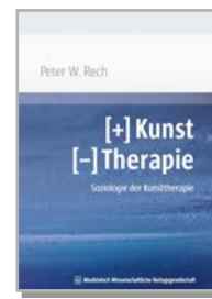
ISBN 978-3-939069-33-1 2007, € 19,95 [D]