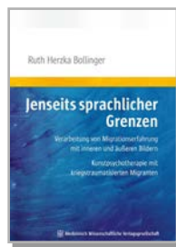
ISBN 978-3-939069-58-4 2008, € 24,95 [D]