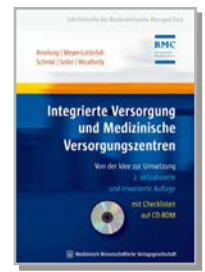
ISBN 978-3-939069-57-7 2008, € 49,95 [D]

Ja , hiermit bestelle ich zur Lieferung gegen Rechnung: (innerhalb Deutschlands, Österreichs und der Schweiz)