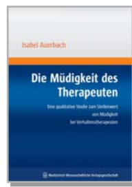
ISBN 978-3-939069-01-0 2006, € 34,95 [D]